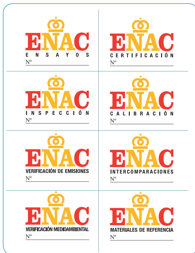
Marcas de acreditación para las diferentes actividades de evaluación de la conformidad

Por tanto, la actividad acreditada es únicamente la que se desarrolla dentro del alcance de acreditación, motivo por el que es necesario saber cómo identificar las actividades acreditadas.