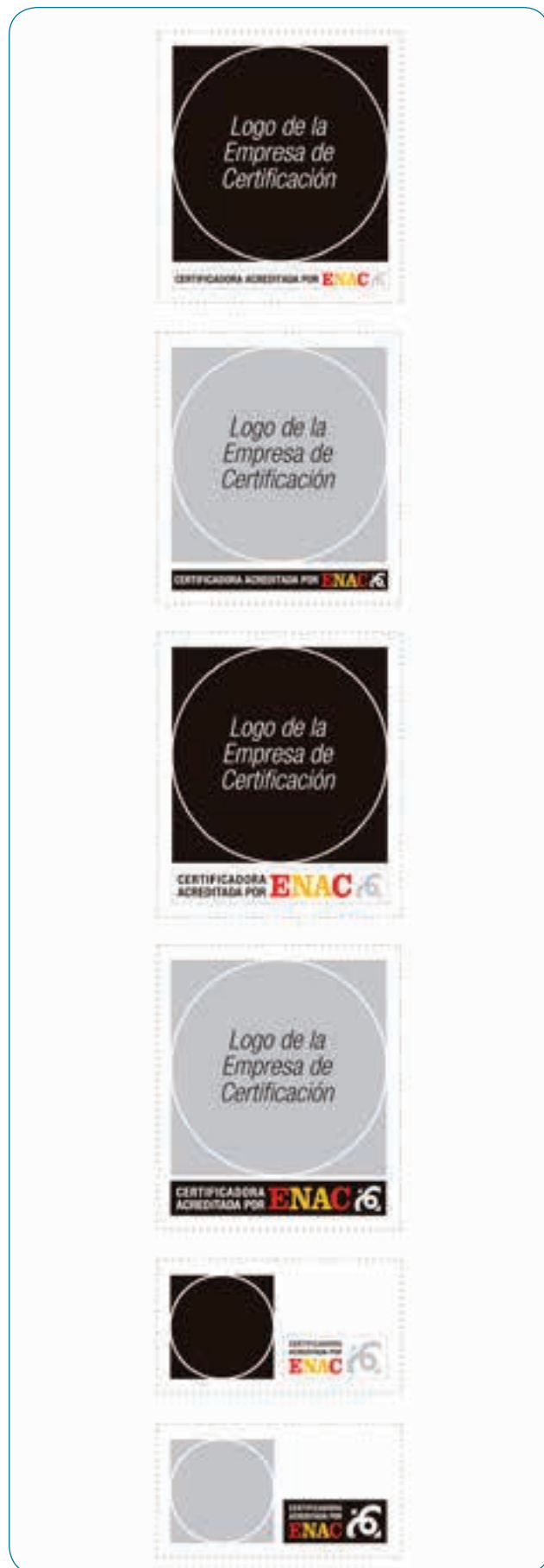
Ejemplos de las Marcas de certificación acreditada por ENAC

Adicionalmente, ENAC permite a las entidades de certificación hacer uso de una “marca de certificación acreditada” (MCA). Que un producto lleve una MCA es una demostración de que el certificador que la ha concedido controla su uso y está acreditado por ENAC, pero no que la certificación se haya concedido con referencia a normas por lo que, en cualquier caso, el licitador debería presentar el correspondiente certificado en vigor.