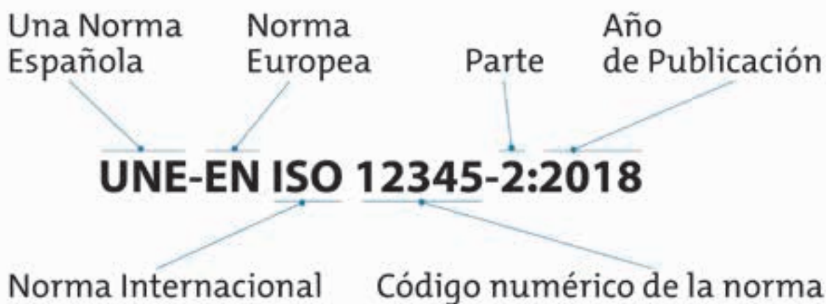
Figura 3: Significado del código de una norma técnica

Para minimizar posibles confusiones en compras públicas, se recomienda citar el código completo de la norma, incluyendo la fecha y el título de la misma.