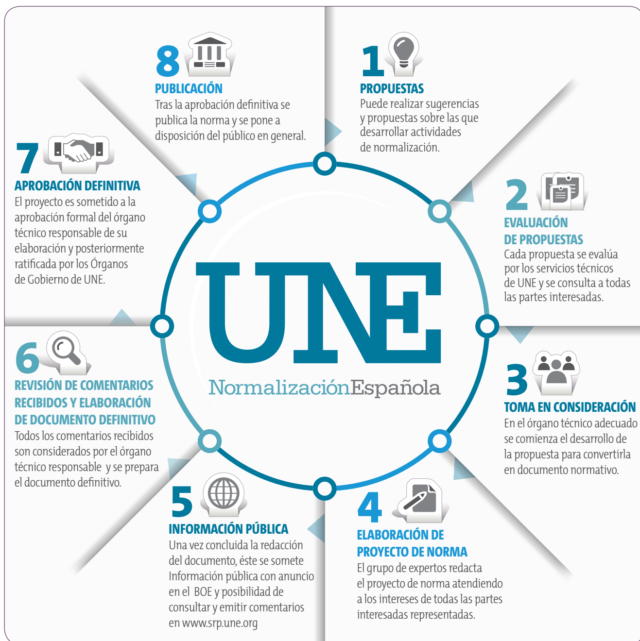
Figura 5: Proceso de elaboración de las normas UNE

de Normalización (CTN) de UNE, que están abiertos a la participación de todas las partes interesadas para potenciar un debate plural. Las decisiones se toman siempre bajo unas condiciones de consenso muy exigentes, garantía de imparcialidad -dos tercios para los proyectos de norma- y los documentos son sometidos a un periodo de información pública en BOE, accesible en la web de UNE. Todos estos factores aseguran la transparencia en el desarrollo de las normas y que se ha llegado a la mejor solución técnicamente posible.